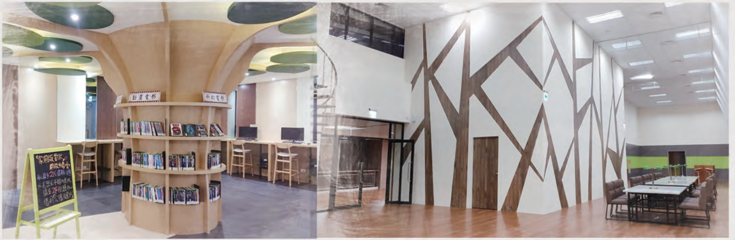
圖書館1樓知識樹 / 圖書館4樓知識樹延伸