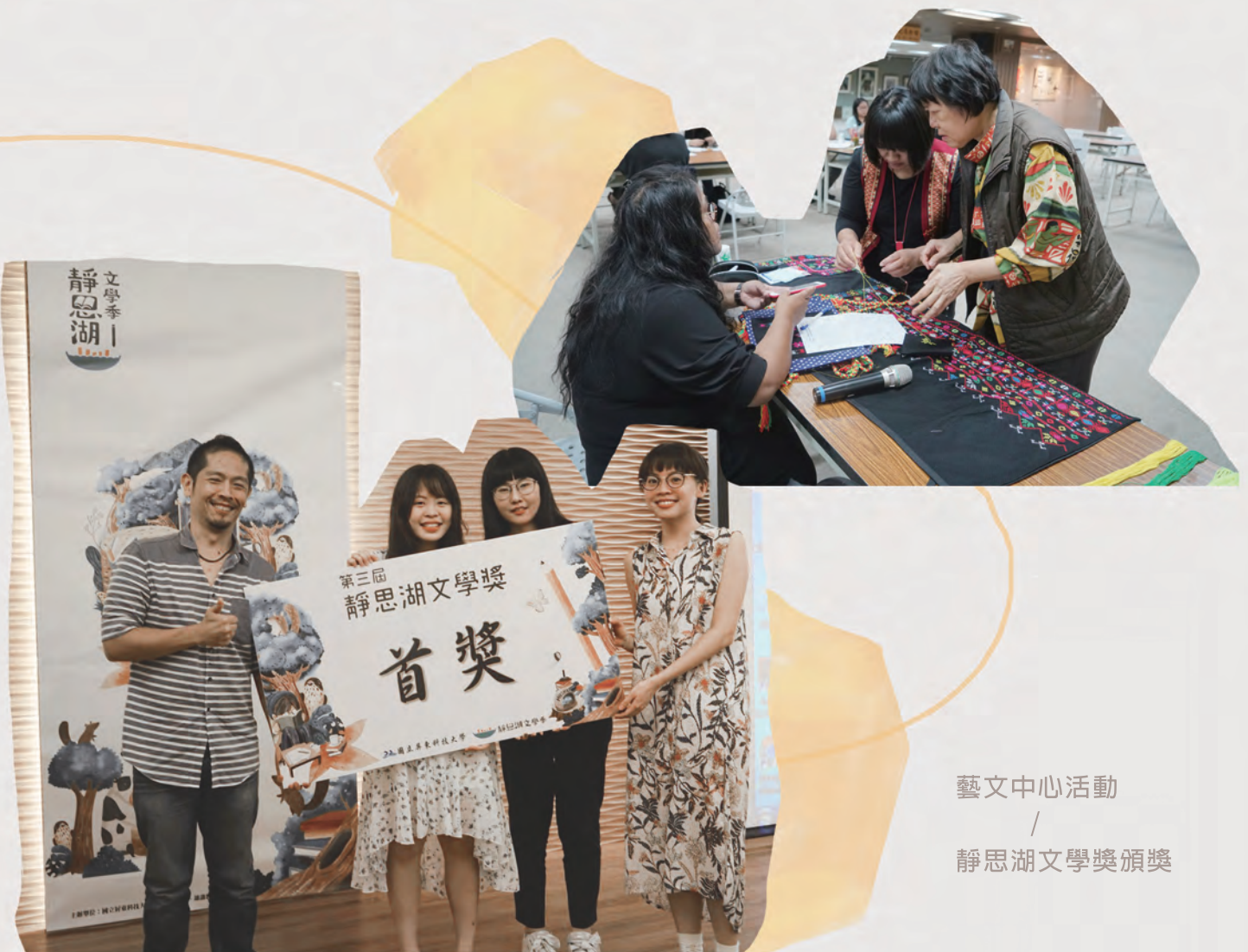
藝文中心活動 / 靜思湖文學獎頒獎