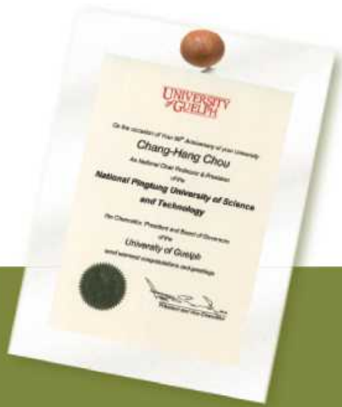
姊妹校加拿大果爾夫大學等 十餘所學校來函祝賀校慶