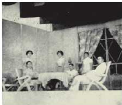
話劇表演一假鳳凰 (二)