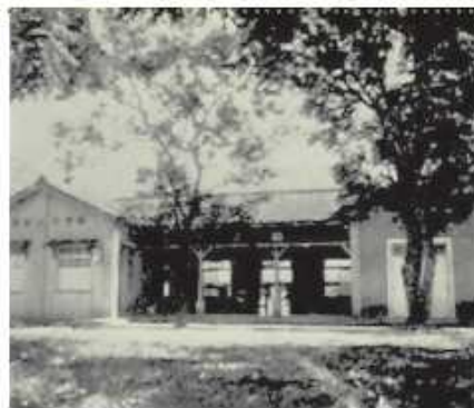
1950年家畜診療所落成並易名為家畜醫院對外應診