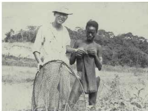
擔任農耕示範隊校友與當地居民合影