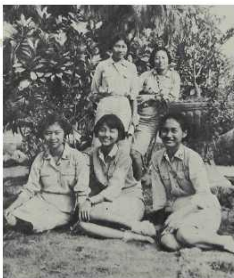
50年代的屏農女學生