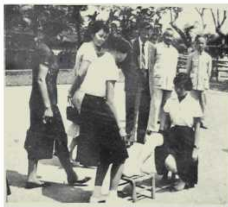
護理課程成果示範表演