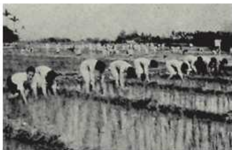
女學生農場實習情景