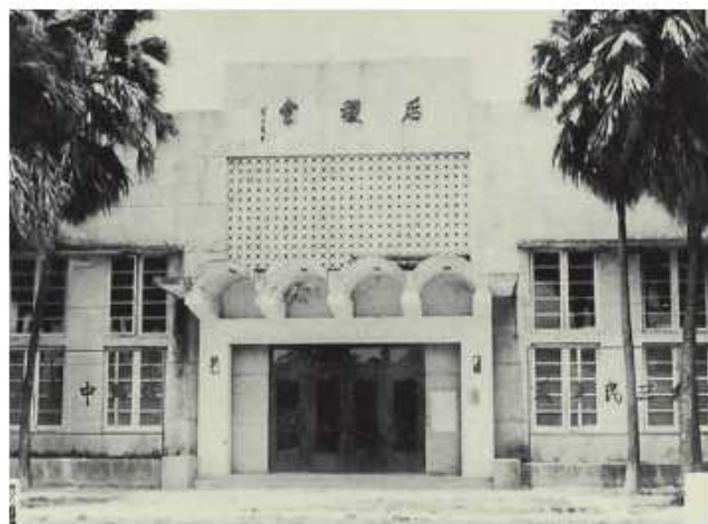
1962年由修建費、家長會樂捐款暨教建基金貸款興建的「后稷堂」大禮堂