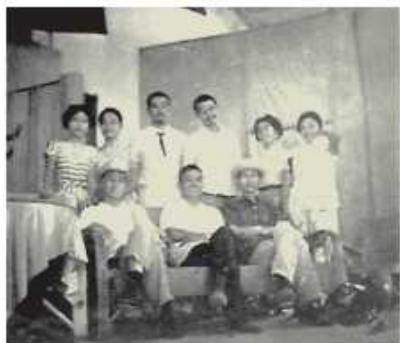
話劇表演一假鳳凰 (一)