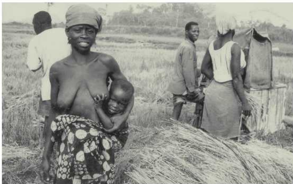
校友擔任農耕示範隊團員以農業技術援助第三世界國家