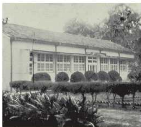
實用技藝訓練中心外觀