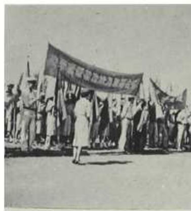
本校運動選手於屏東縣立體育場參加第八次中等以上學校運動會暨慶祝民國四十八年青年節大會