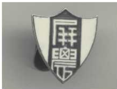
屏農學生制服袖扣