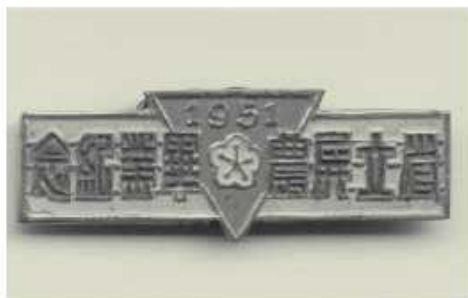
1951年屏農畢業紀念胸章