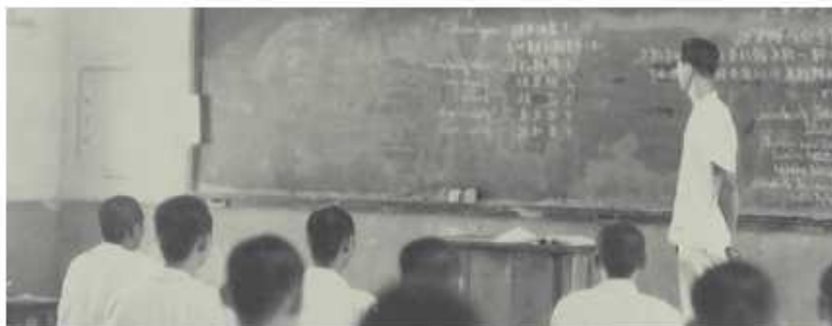
農產製造科阮再訪主任教授微生物課程