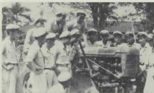
曳引機使用講授課程