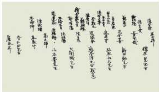
右圖人物對照說明