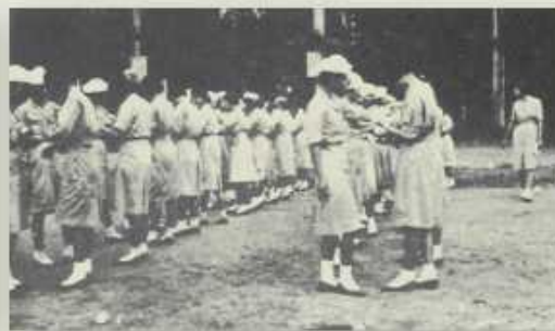
女生於護理課程時學習為傷患包紮