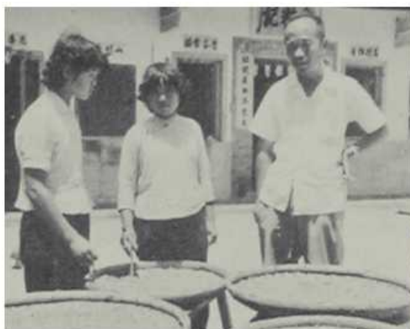
技藝訓練中心至各鄉村開辦農產加工講習班