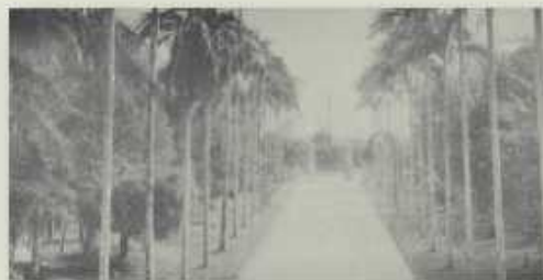
大門口直通玄關的椰林大道

寮有五室，每室室員十二至十五名，全部學寮可容納三〇〇名以上。學寮內設有圖書室、舍監室、盥洗場、廁所、洗澡場、晒衣場、豪華餐廳、炊事場及宿舍花園等等應有盡有，是全台之最，風迷一時。每月的學寮費由早期的十五圓漲到二十圓，那時中級公務員薪資大概四十圓，要維持一個孩子在外念書實非易事，有些家庭甚至須三個母姊做工維持才能負擔一個弟弟的學寮費、交通費等。