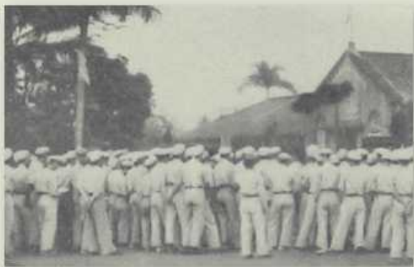
學生於操場聆聽演講