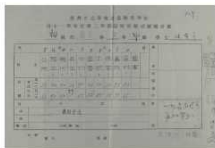
初級部學生臨時試驗成績報告單