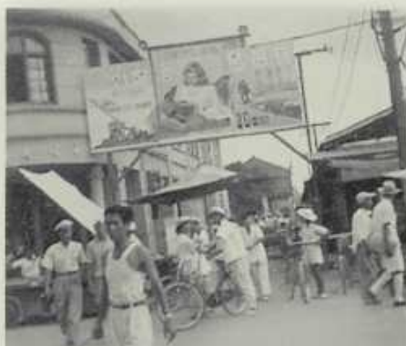
仙宮戲院是學生假日的去處之一