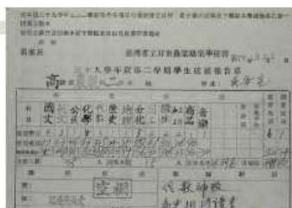
高級部學生成績報告單