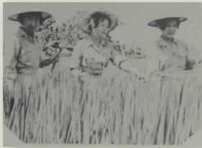
本校首開省立農校增設女生班先例，女學生農場實習情景