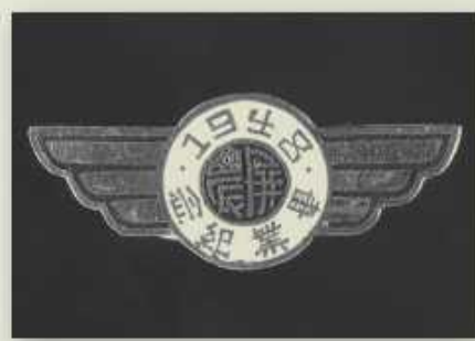
屏農畢業紀念胸章