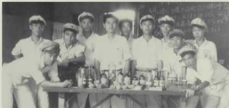
畜產製造酸奶蛋飲料加工實習