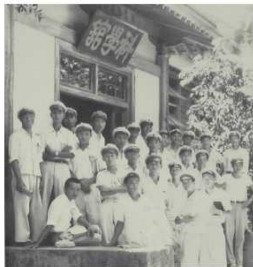
農藝科學生攝於科學館前