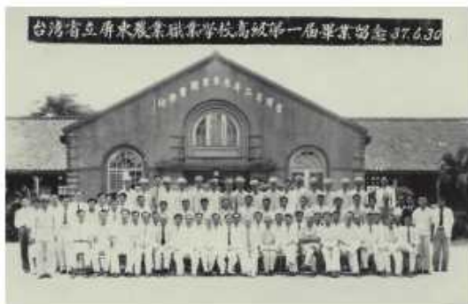
省屏東高級部第一屆全體師生於玄關前畢業合影

昭和十六年（一九四一年、民國三十年）四月進入日治時期的高雄州立屏東農業學校農業科（學校設有農業科及畜產科，每學年各錄取五十名學生）。校址就是現在屏東師範學院所在地。當然其校門及校舍並沒有現在屏師院的美麗堂皇而只有很樸素的兩棟平房校舍及五棟平房學生宿舍、牛舍及馬廄等教學用的附屬建物以及廣大的實習農場。當年十二月八日太平洋戰爭爆發，至一九四三~一九四四年戰