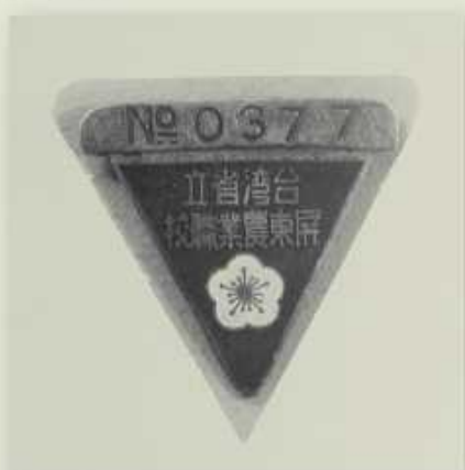
屏農學生腳踏車車牌