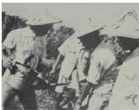
上圖及下圖為學生利用寒暑假至偏遠鄉村服務貢獻所學富裕農村