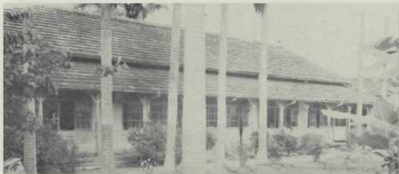
宿舍（日治時代建造之學寮）

本校現分綜合農業、畜牧獸醫、農產製造、農業機械、農業土木等五科，各設科主任。另於教務處下設設備組，掌理教學設備；事務處下設營業組，專司作業產品之出售工作。又農產製造科下轄加工廠一所；畜牧獸醫科設畜牧場