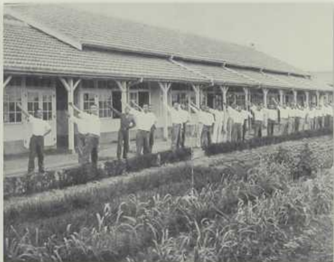
住宿生早起作早操，前為菜圃後為宿舍