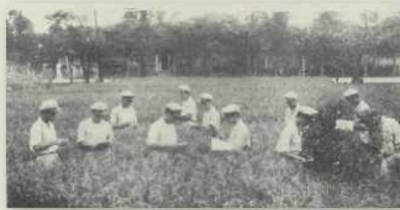
學生從事水稻品種比較試驗田間調查