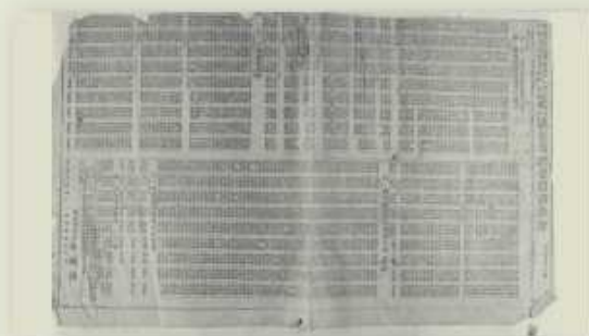
本校學生參加高級職業學校就業考試成績斐然