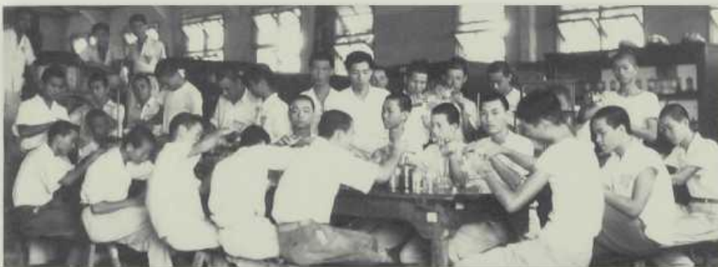
農業化學實習食品成分分析