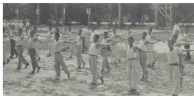
升旗典禮後做體操

都很單純，尤其經過民國三十六年發生的二二八事件後老百姓更不敢表達自己的意見或看法，整個社會只有在政府說什麼就是什麼。而工商業尚未發達的年代，如無靠山要就業實在難如登天。所以從高三上學期末開始，很多學生就覺得很無助，除了決定升學的學生外，對畢業後的出路覺得毫無把握。當時那