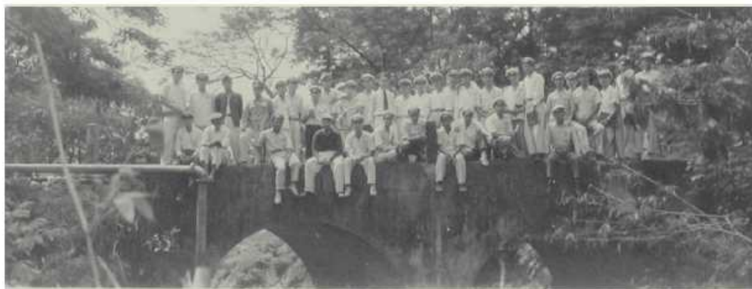
森林實習學生攝於本校眼鏡橋