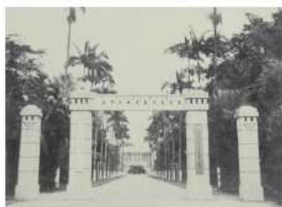
1950年10月省立屏東農業職業學校校門重新興建完工。