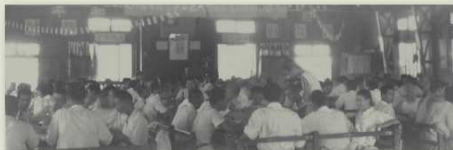
1952年畢業生於禮堂舉辦謝師宴