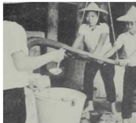
技藝訓練中心教授農村婦女米食加工（磨米）