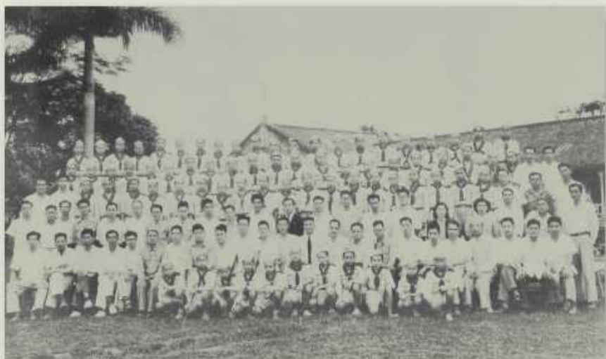
1953年初中部農藝科全體畢業生與全體教職員於玄關前合影

危而未想到這麼一跑，萬一賈梅總統的荷槍戍衛認為我要衝向總統而開槍，其後果不堪想像。在跑過距賈梅總統前約10公尺時，賈梅總統拍手，其他人員也隨之拍手，而我只揮一次手致意，續奔耕耘機處，到達時，耕耘機正開始斜上田埂，我立即將耕耘機之左右轉向離合器把手同時上拉，車子失去前進動力而下滑到水田，解除翻車意外之危機，之後，向大家說明，我奔跑的原因。