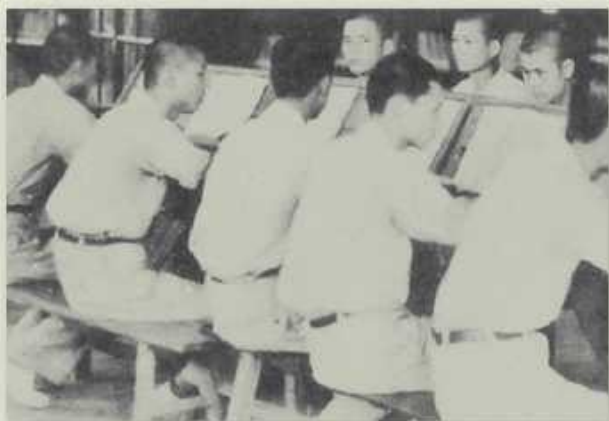
學生利用課餘在圖書館翻閱書報