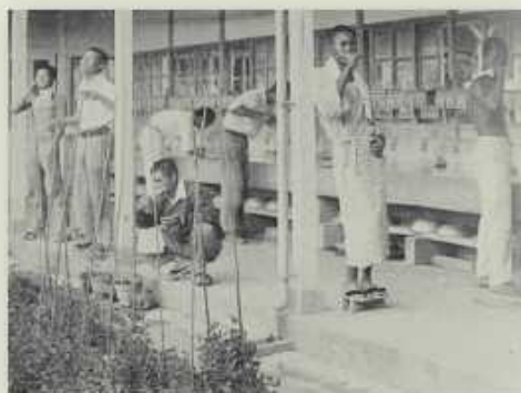
住宿學生清晨起床後刷牙洗臉準備用餐