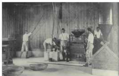
農業科學生農產加工實習