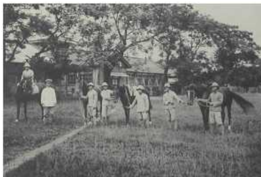
畜產科學生必修的馬術實習課程

州立農校成立之初設農業科及畜產科，修業年限為五年，每科均招收台籍及日籍學生共四十名。最初的校舍是由牛疫血清製造所改建而成，其畜舍改建為教室，職員宿舍作為老師宿舍，地點位於黑金町，即現今復興陸橋下的屏東夜市處。三年後遷至殺蛇溪旁民生路校區（編按：農專時之北校區），即現今屏東師範學院東校區位址。