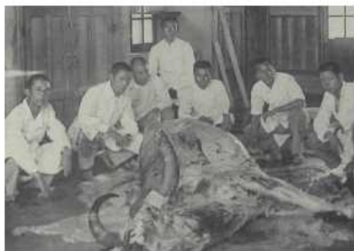
畜產科學生解剖實習

在校期間成績優良，五年期間始終第一名，一直擔任班長又是第一屆學長，領導同學培養出良好的校風，如不邊走邊吃東西，二人同行須並排行走，四人同行時須兩人一列並排行走，學長發現學弟有錯誤的行為可當場糾正或教訓等，講究校園倫理，尊師重道。