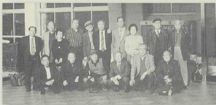
1998年11月瑞穗會下關總會校友同學會後合影