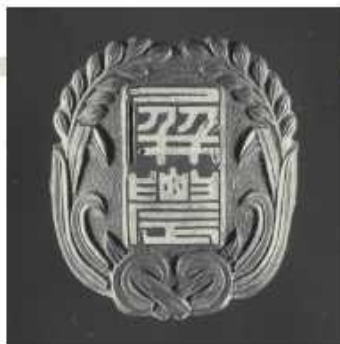
州立屏東農校校徽