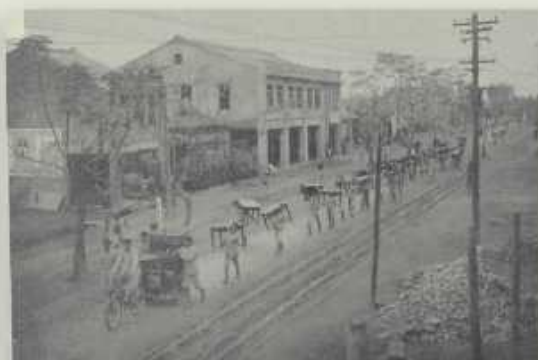
1931年自黑金町校區遷入瑞穗町新校區之情景