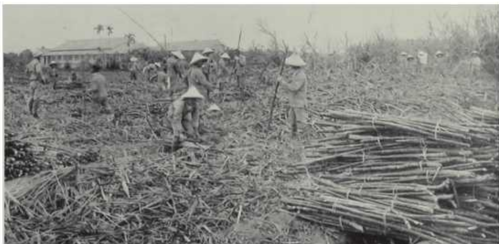
農業科學生甘蔗田間實習

畢業後，至東港一所國小擔任教員約二年，後改考高雄州產業指導員，派駐於萬丹庄擔任指導員，指導農民栽培技術，教導農民堆肥、施肥，設輪間作實驗區，舉辦說明會並請農民觀摩等，使原本一年水稻二作，三至四個月休耕的情形，改為一年三收，高度利用農地。磯永吉博士從日本帶原生蓬萊米種子來台並研究成功，台中65號蓬萊米抗稻熱病較差，適合於中部地區栽種，高雄10號抗稻熱病強適合於南部地區種植。農民所需的稻種是依田地的多寡由改良場從稻種田採收的稻種分配農民栽種，不能自行留稻種種植，以維持稻米品質。且因蓬萊米栽培方式與一般水稻不同，故設置模範區觀摩示範，以鄉鎮公所為單位，成立農業實行組合（如現今產銷班），由保正（相當於現今的村里長）兼任組合長，產業指導員利用夜間舉辦說明會，並教導農民以正條密植法，將種植間距與行距劃分好後插秧，以增加產量。南部每年六月初為前雨期（梅雨期），水稻遇雨季容易傾倒發芽，故須在前雨期前收割完畢，指導農民以種植到收成之天數推算播種時間，避開前雨期減少損失。