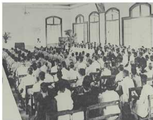
1928年慶祝州立屏東農業學校開校式