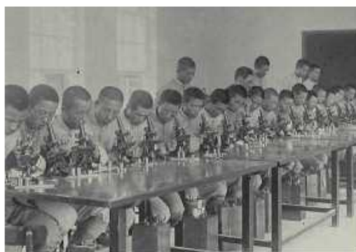
學生以顯微鏡觀看微生物