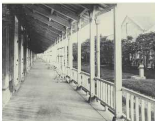
瑞穗町校區第二排教室及走廊