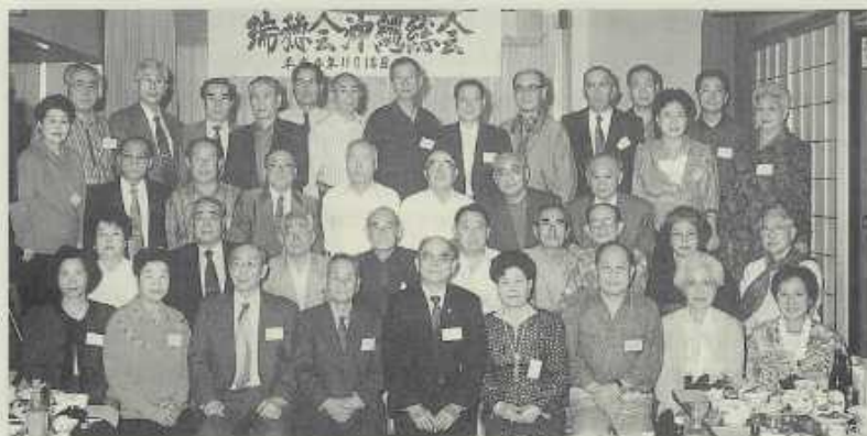
1992年瑞穗會沖繩總會校友同學會後合影