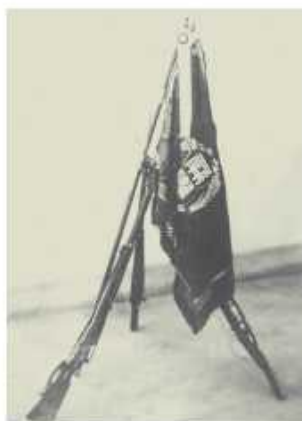
州立屏東農校校旗