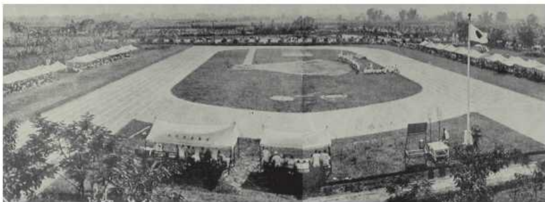
瑞穗町校區運動場