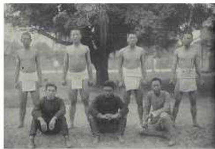
相撲社學生與教練合影