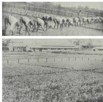
上圖為獻穀田中舉辦獻穀祭插秧儀式，所種新穀作為神社舉辦新嘗祭時的獻禮。下圖為獻穀田以竹籬笆圍住防止一般人進入

新嘗祭是君臣要成爲一體，向皇祖大神敬拜的儀式，獻穀是國民對國家感恩的表現。如是宏恩，誠不知如何報答君恩於萬一！