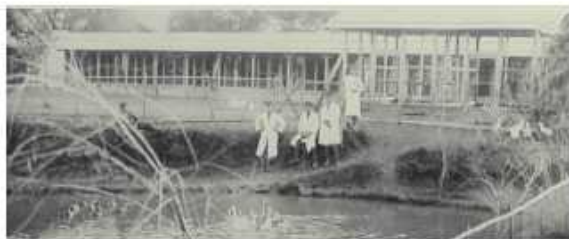
畜產科學生於水禽場實習

當年農校有嘉義農林學校、宜蘭農林學校，及屏東農業學校共三所，而畜產科僅州立屏東設立，也是唯一培養獸醫師的學校，當時能考上州立屏東的同學程度上都是非常優秀，而同學們的家境普遍不佳，但都能努力向上。當年州立屏東學生以日本籍佔三分之一，台灣籍佔三分之二，全校不分台灣人或日本人都能和睦相處。每個學科均有一位任教老師，以日籍教師為多，僅一位台灣籍物理老師。日籍老師是經日本總督府篩選過後以優於日本國百分之六十之薪俸聘請過來，都很優秀，也都很疼惜學生。學校除正式課程外，另設有柔道部、相撲部、劍道部、野球部及競技部，提供同學們課外的活動。