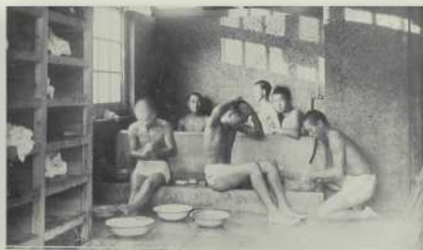
住宿學生放學後至澡堂沐浴