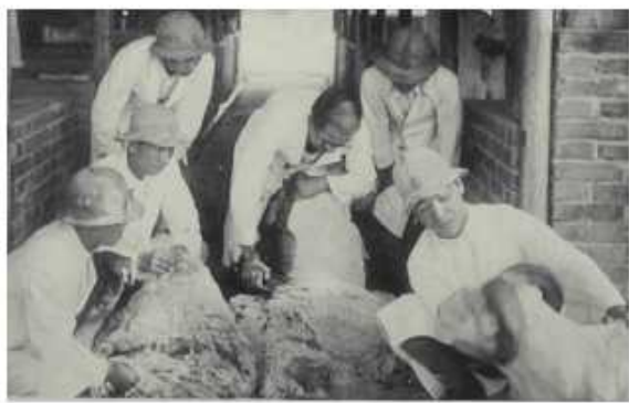
畜產科學生剪羊毛實習

州立屏東除當時高雄中學以外，是高高屏地區的另一所最高學府，且因成績優秀，老師推薦我利用暑假期間至東港鎮長家擔任家教，為二位要考中學的小孩補習功課，因成效不錯，鎮長付了60銀圓當酬勞，也因這一大筆錢，幫助其往後三年學校的所有支出，順利完成學業。