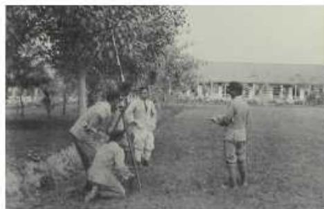
農業科學生測量實習