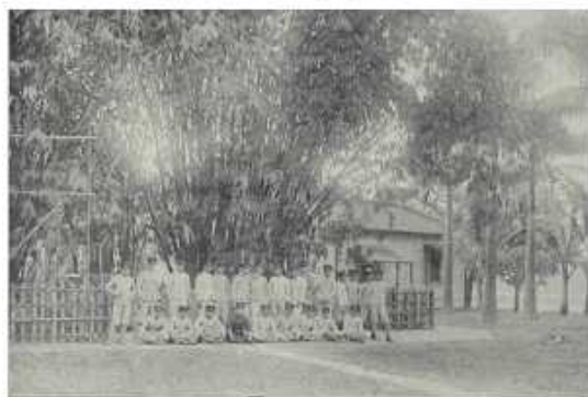
同學參拜親王紀念瑞竹