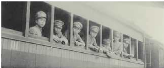
腳踏車（上圖）與火車（下圖）為上學主要交通工具

04月 農校第十八屆學生入學（部份學生編入省立農校初級部第三屆）。 州立農校校地有屏東郡瑞穗町（現為香揚巷段）22、24、26、27、28、29、69、83號、若松町二丁目（現為街頭二小段）71之3、72號及現今屏東市南京路文明二小段19號，面積計18.04325甲（17.50046公頃）。