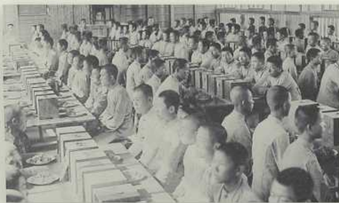
住宿學生用餐情景