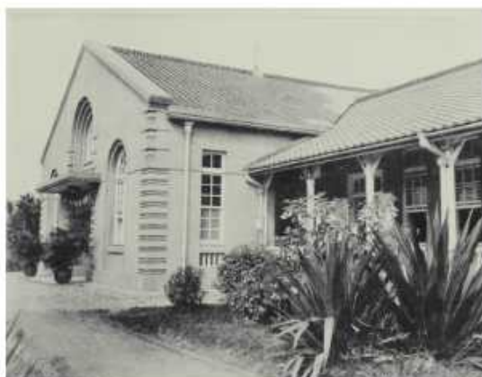
瑞穗町校區辦公廳及第一排教室