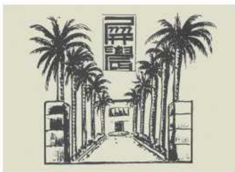
日本校友描繪的州立屏東