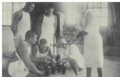
農業科學生農產加工醬油封罐實習