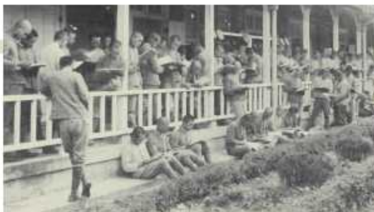
考試前同學聚集於教室外走廊埋首準備