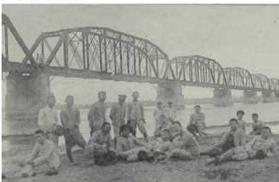
學生至下淡水溪（高屏溪）遠足，於鐵橋前合影，今因鐵橋年限已久，不再使用但成為高屏地區觀光景點