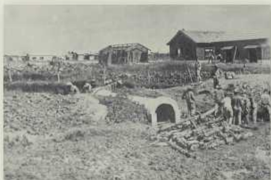
上二圖為學生至瑞穗町新校區整地勞動服務情形