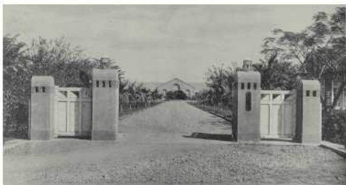
1931年州立屏東農業學校瑞穗町校區（現址屏東市民生路農校巷2號，今屏東師範學院東校區）校門