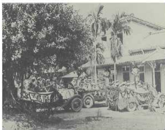
1928年慶祝州立屏東農業學校成立活動