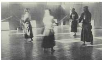
劍道社學生練習活動

一群搗蛋鬼又聚集在一起，商量要去下淡水溪鐵橋下偷西瓜。記憶中，我們都沒上學，吃了好多好多西瓜。