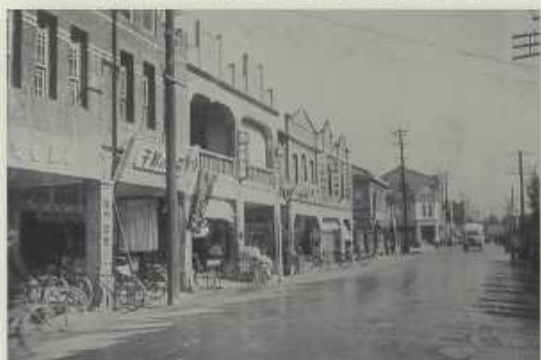
日治時期的屏東市一街景