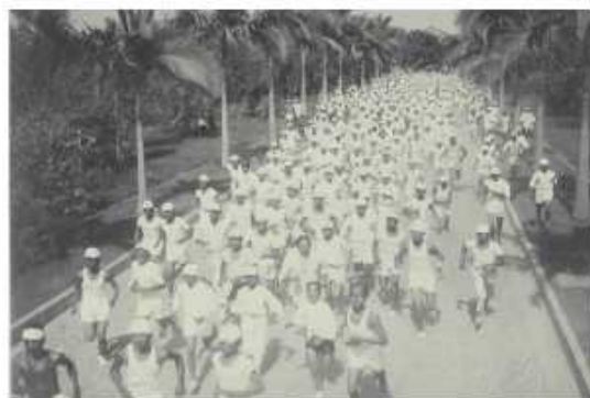
利用週日施行馬拉松長跑