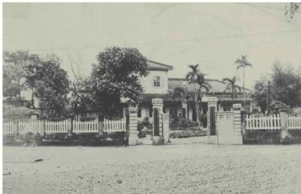
1924年本校創校之始，高雄州立屏東農業補習學校校門，創校奠基於原牛疫血清製造所位址。1928年擴大為高雄州立屏東農業學校初期仍以此為校舍。