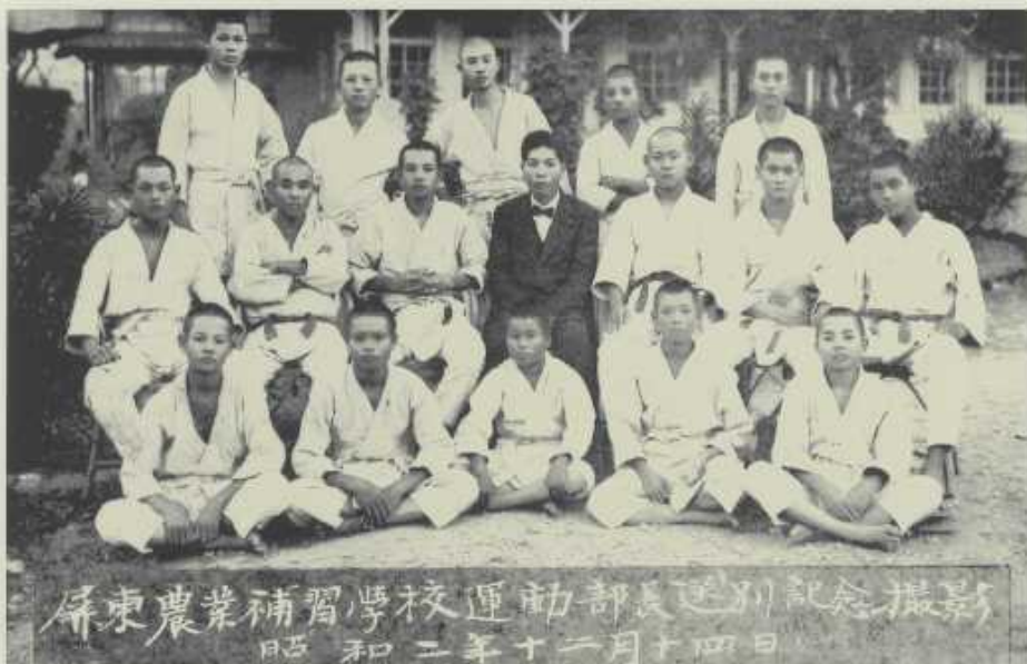
1927年補習學校同學歡送運動部長留影